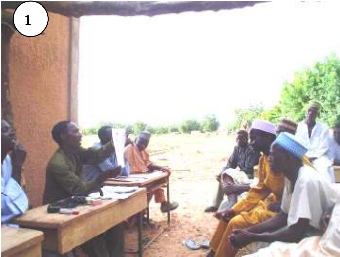
1) Sensibilisation sur l'autopromotion et Explication des attributions des membres du bureau CVD à la 1ere Assemblée générale