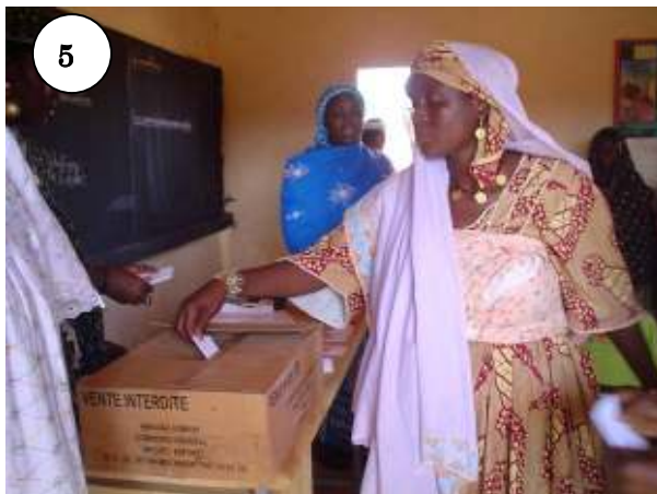
5) Une éléctrice en train d'introduire l'enveloppe dans l'urne.