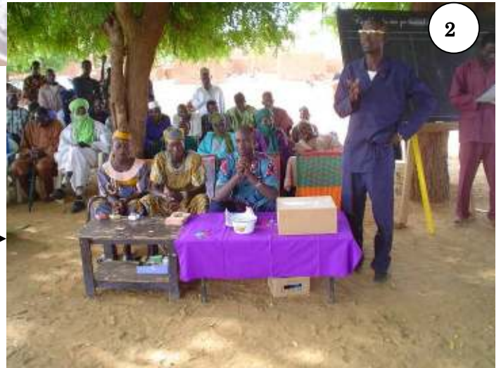
2) Un membre du comité d'élection Présentant le comité indépendant des élections mis en place à la 1ere AG et expliquant le processus électoral