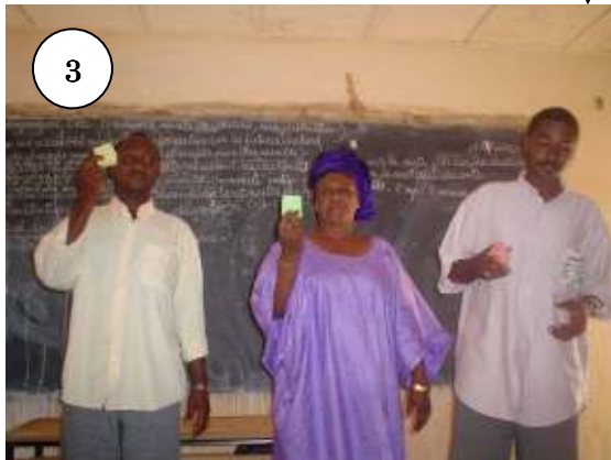
3) Présentation des bulletins par les candidats à un poste dans le bureau