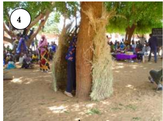
4) Un électeur dans l'isoloir lors d'une élection du bureau CVD