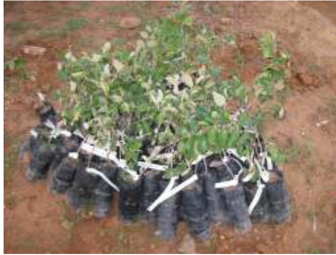
Irin icce magarya a cikin ledodinshi

A lokacin ɗari, girman iri ba ya da sauri, yana kai har watanni 2