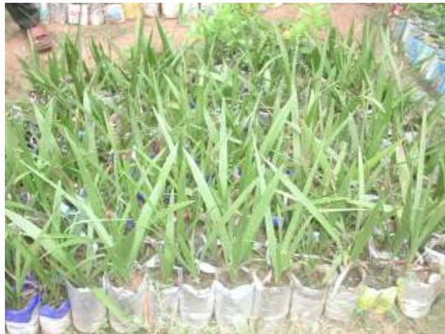
Ga irin iccen dabino a cikin ledodi

A sami ɗiyan dabino da suka kai wata shidda bayan an taɓo su A jiƙa su cikin ruwa su yi awa 24 don su yi saurin tsirowa. A shibka ɗan dabino 1 cikin kowace leda. A ruhe kuma a bada ruwa duka kwana 3