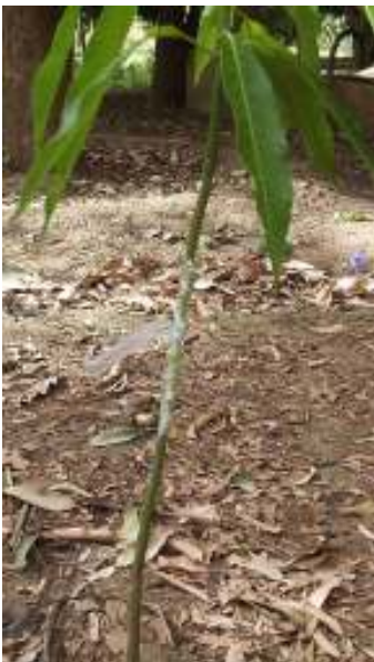
3. Guntun iccen girefe ya gamu sosai da iccen