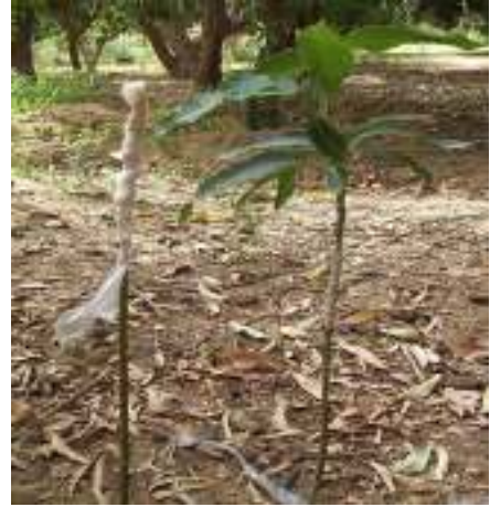
Mangwaron da aka yi ma aure ko girefaji na fanti