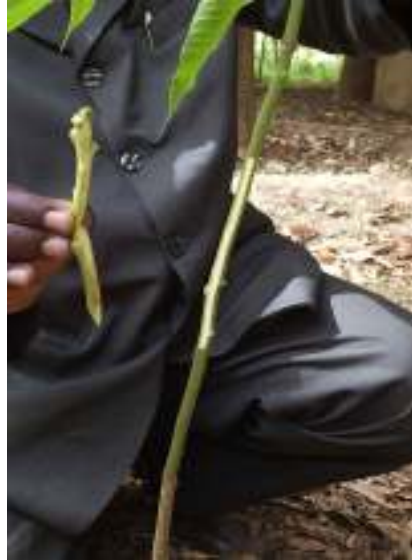
2. sassaƙar da aka yi bisa iccen da za a yi ma aure ko girefaji