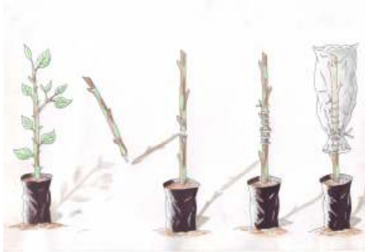
Girefaji kurna ta hanyar fanti