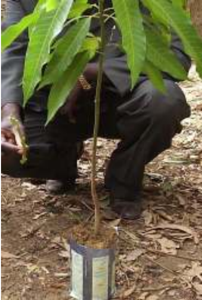
1 Iccen da za a yi ma aure ko girefaji an hidda duk ƙananan kunnuwa