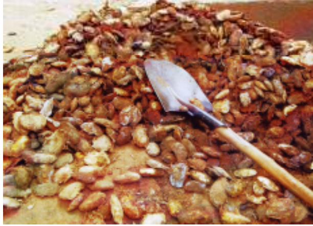
Tulin diyan mangwaro

Diyan mangwaro tsotsattsai da ake yadawa, sune aka tsintowa a cikin kasuwa ko a ci jardan na mangwarori.