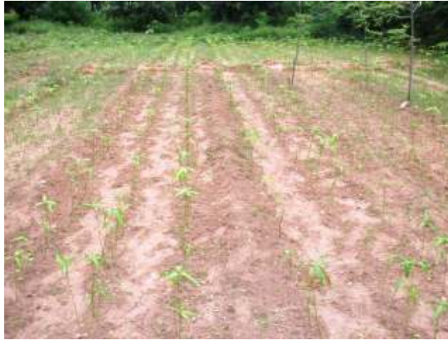
Itatuwan mangwaro bayan an dasa su

6. kaƙa ake tattalin itatuwan da aka shibka da waɗanda aka dasa?