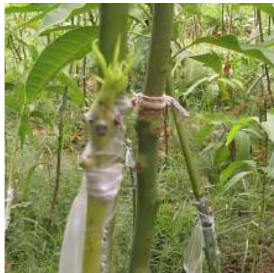
4. mangəru wa yiggan azalaf wan fanti