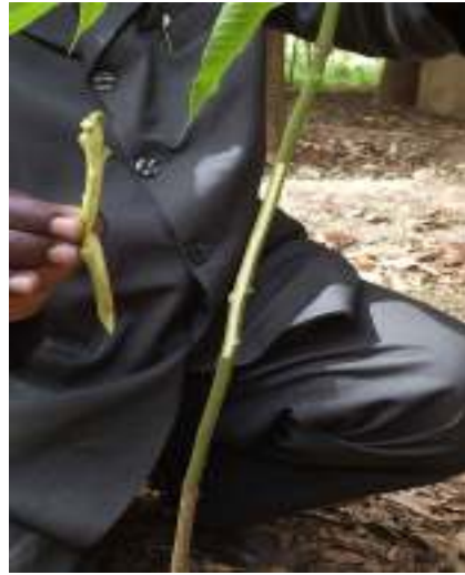
2. amakno yiggan fel aşik ya yikkan igi n-azalaf.