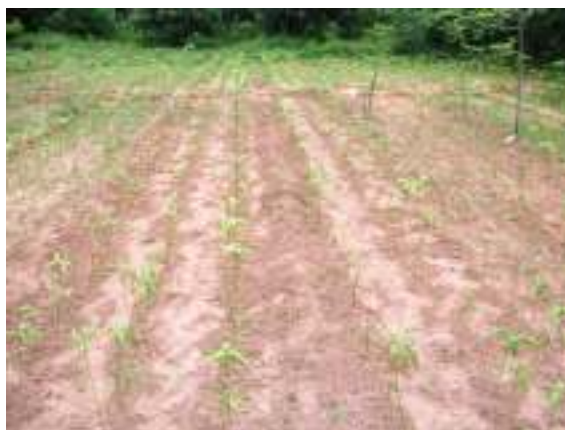
Eşkan mangəru dəffər tanbəlt nasan.