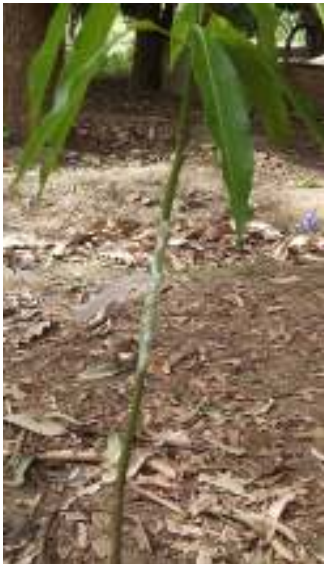
3. Aganan aşik gərəfe Yibazan s-uluy day aşik