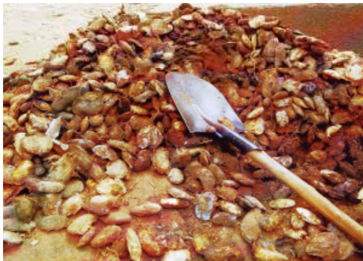
Aratan ən mangəru

Aratan ən mangəru win ətwagaran əntini a yitawagmayan day əssuk mey day ifirgan win mangəru.