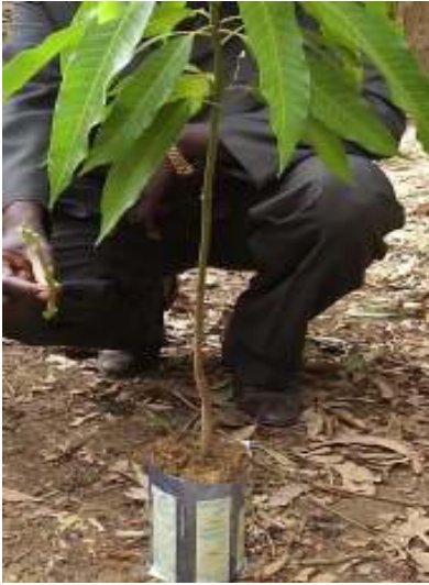
1. Aşik wa yikan azalaf wan gərəfe ətiwakasan lattan win madronin