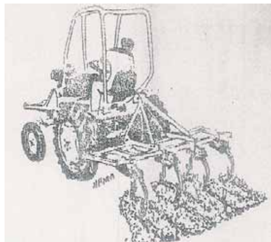
Ɖhoto 6 :