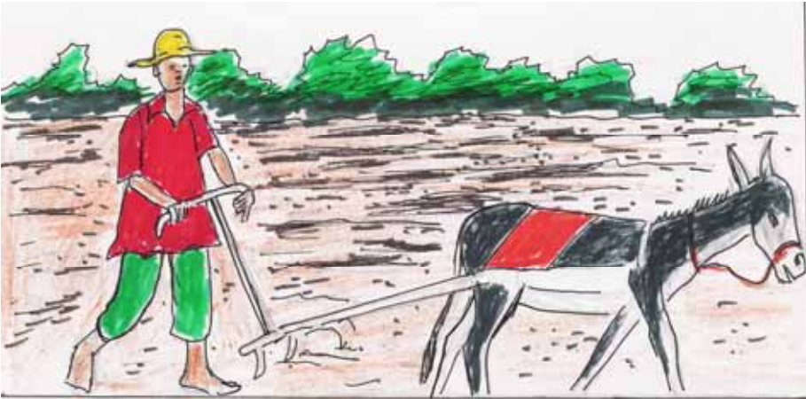
Ɖhoto 4 : Igi ən tamaqqawst əd taki tan azzaman