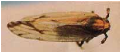
C = Sikadel wa maqqaran