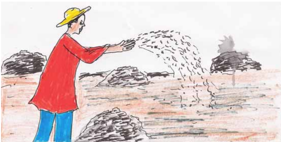
Fhoto 3 : Igi ən taki tan azzaman