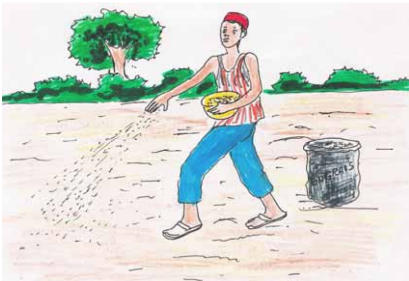
Fhoto 2 : Igi ən taki tan tamaqqawst