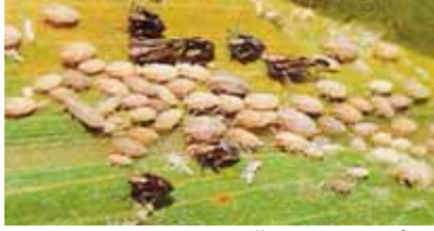
A = Ijan win šitawannu sikadel