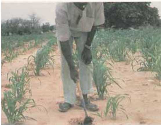
Èhoto 12 : Èzèwèzwèzi èn taki èn kalmi