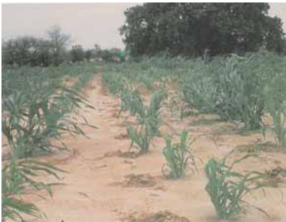
Èhoto 13 : Tawagost d èffèr èwèziwèz èn taki