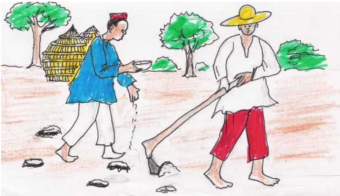
Ehoto 8 : Isənbal n abora