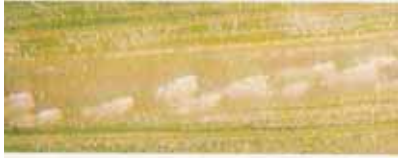
B = Hikakalen ən sikadel əwarnen Alamtay ilsenat arat iyyan mallan