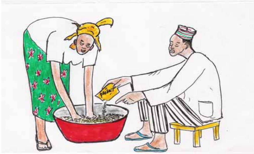
Ɖhoto 7 : Igi n amagal dyɣ amasa