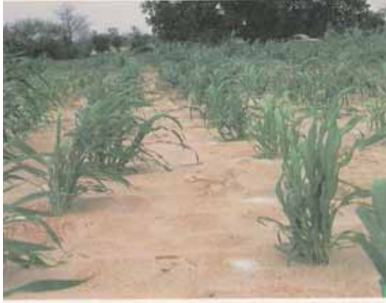
Èhoto 11 : Èsènsi èn taki tan ire dyu 10 cm èn sènbal.