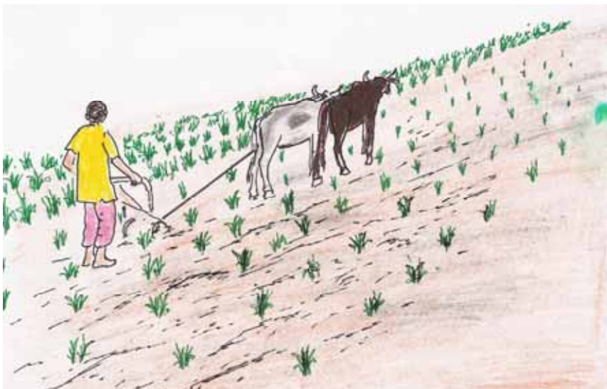
Ehoto 9 : Agayak n abora

Agayak itaggu əs kalmi, tagamsak, made maşinatən šin azzaman.