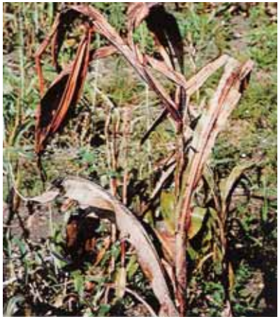
D = Ilamtaɣan n abora təqšad Təwərna ən jan win šitawannu sikadeltan