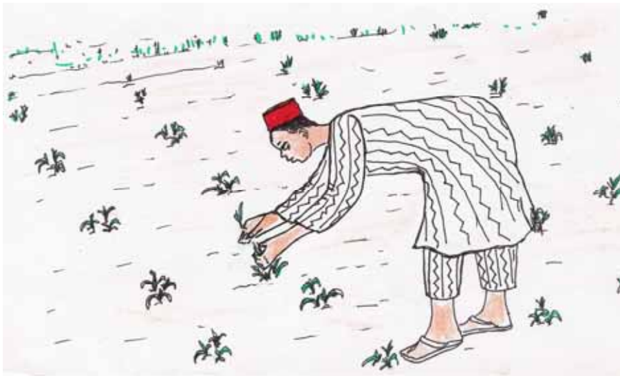
Æhoto 10 : Afanaz n abora

Afanaz yur agayak wa azzaran ad itagg made dæffær æs. Anu kul ihor ad tæhanat karadat tæsæqta. A fanaz imos infan isænbal wallen, blas isaryas tadwala nasan.