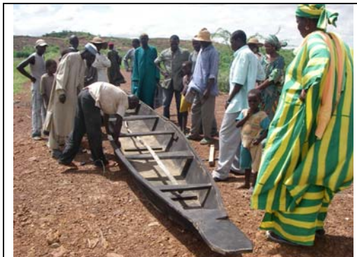
Jirgin ruwa na kwatako