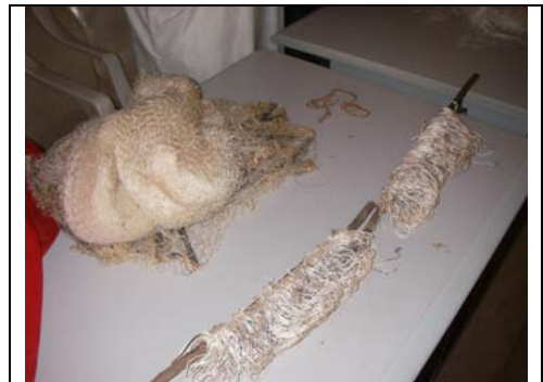
taru , birgi , mamari....