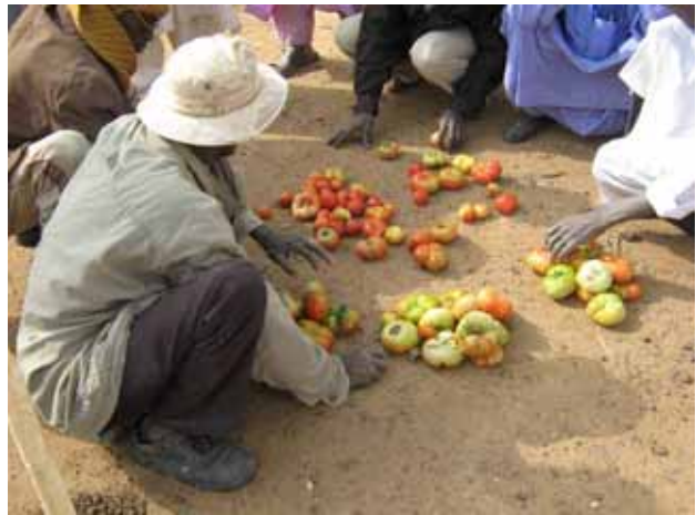
Təmatumt tan marmande təlilat aman ci mətqqrət