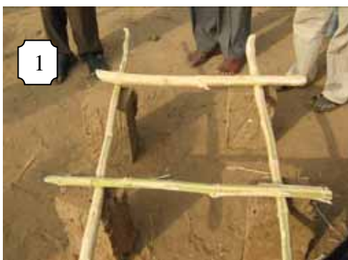
1. Tēmawit ta tēlla akabal ən 4 birgitan.

Təfragam igi cidba cin təzoli win sange fell səmmətti megh win eshkan fell iguz n-adu daw tēmatumt. Iyyat tēmawit tan tiyan tēmatumt day tēfuk fell tasagay. Sagay təggat əs eshkan əlsantat cisalaten. Sagharat tēmatumt day tēfuk fell cisalaten cin alumuz. Adu yəfrag akkay daw əd fell tēmatumt tēfanaz aksəd day tuksay.